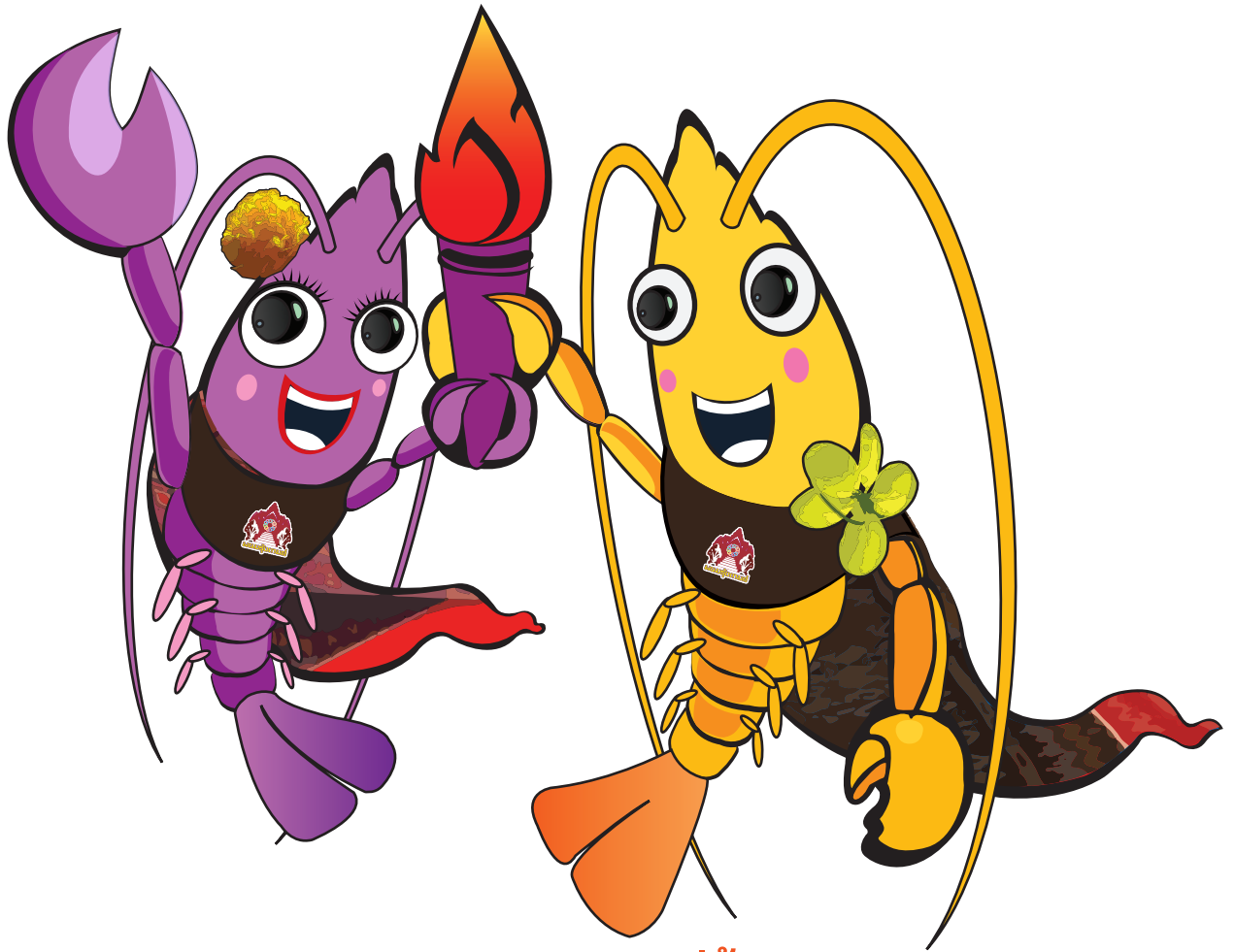
น้องฝ้ายคำ