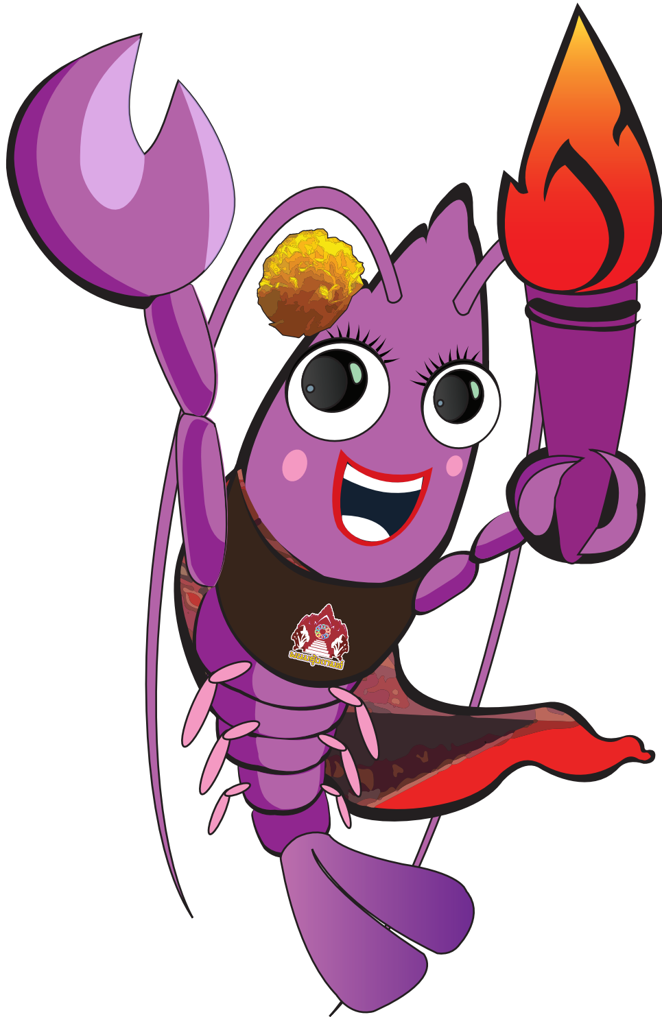
น้องฝ้ายคำ